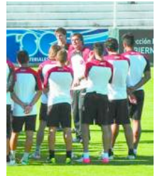
B Nacional: Diego Osella confirmó los titulares que recibirán a Instituto