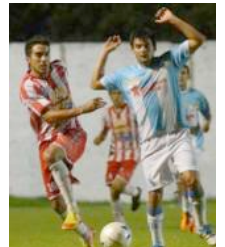
Hubo variantes en fixture de la Zona 8 del Torneo Argentino B de fútbol