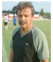
Copa Argentina: Gimnasia partió a Chaco con la formación confirmada